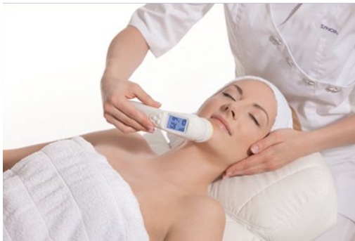
LE WISHPRO ! UN BREVET MONDIAL .

Aujourd'hui, la technologie unique du WISHPRO permet un rajeunissement visible en seulement 15 minutes .